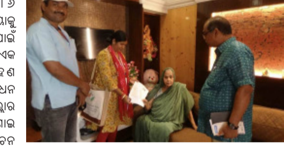
ମାଲକାନଗିରିର ଅତିରିକ୍ତ ଜିଲ୍ଲା ନିର୍ବାଚନ ଅଧିକାରୀ ଏବଂ ସ୍ୱପ୍ନ ପ୍ରସାଧ ଅଧିକାରୀମାନେ ବିଭିନ୍ନ ଗ୍ରାମ ପରିବର୍ତ୍ତନ କରି ବରିଷ୍ଠ ଭୋଟରମାନଙ୍କୁ ଭେଟିବା ସହ ସେମାନଙ୍କୁ ସ୍ୱତନ୍ତ୍ର ପରିଗଣନା ଫର୍ମ ପ୍ରଦାନ କରିଛନ୍ତି । ବୟସାଧିକ କାରଣରୁ ମତଦାନ କେନ୍ଦ୍ରକୁ ଆସିବାକୁ ଅସମର୍ଥ ଥିବା ଏହି ବରିଷ୍ଠ ନାଗରିକମାନଙ୍କୁ ସମ୍ମାନ ସହ ସେମାନଙ୍କର ଅଧିକାର ସୁନିଶ୍ଚିତ କରିବା ଏହି ଅଭିଯାନର ମୁଖ୍ୟ ଉଦ୍ଦେଶ୍ୟ ରହିଛି ।

ମାଲକାନଗିରି, ୩୩୬ (ଆନିସ): ଜିଲ୍ଲାରେ ଗଣତାନ୍ତ୍ରିକ ପ୍ରକ୍ରିୟାକୁ ଅଧିକ ସୁଦୃଢ଼ ଓ ସର୍ବବ୍ୟାପୀ କରିବା ପାଇଁ ମାଲକାନଗିରି ଜିଲ୍ଲା ପ୍ରଶାସନ ପକ୍ଷରୁ ଏକ ପ୍ରଶଂସନୀୟ ପଦକ୍ଷେପ ଗ୍ରହଣ କରାଯାଇଛି । ସ୍ୱତନ୍ତ୍ର ସମ୍ବନ୍ଧ ସଂଶୋଧନ ଅଭିଯାନର ଚତୁର୍ଥ ଦିନରେ ଜିଲ୍ଲାର ବରିଷ୍ଠ ନାଗରିକମାନଙ୍କୁ ସମ୍ମାନ ଜଣାଇ ସେମାନଙ୍କ ବାସଭବନରେ ନିର୍ବାଚନ ସମ୍ପର୍କୀୟ ସେବା ଯୋଗାଇ ଦିଆଯାଇଛି । ୮୫ ଏବଂ ୯୦ ବର୍ଷରୁ ଅଧିକ ବୟସ୍କ ବରିଷ୍ଠ ମତଦାତାମାନେ ଯେପରି କୌଣସି ଅସୁବିଧାର ସମ୍ମୁଖୀନ ନହୋଇ ନିଜର ଗଣତାନ୍ତ୍ରିକ ଅଧିକାର ସାଧାରଣ କରିପାରିବେ, ସେଥିପାଇଁ ପ୍ରଶାସନ ସିଧାସଳଖ ସେମାନଙ୍କ ଘରେ ପହଞ୍ଚିଛି ।