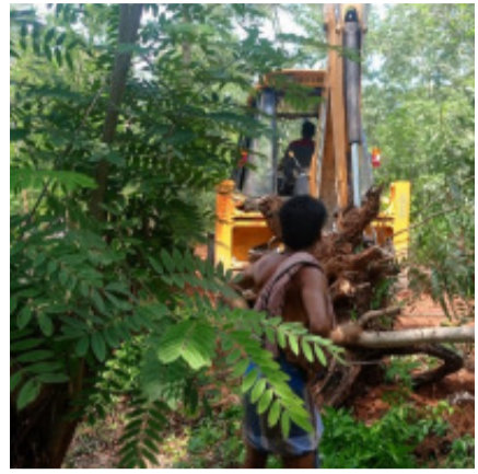
ପଞ୍ଚାୟତ ପ୍ରସ୍ତରେ ଜଙ୍ଗଲ କଟାଯାଉଛି । ଗୁମାସ୍ତା ପଞ୍ଚାୟତର କଲ୍ୟାଣ ମଣ୍ଡପ ନିର୍ମାଣ ପାଇଁ ୫୦୦ ରୁ ଅଧିକ ଗଛ କଟାଗଲାଣି ବୋଲି ଚର୍ଚ୍ଚା ହେଉଛି । ଏହା କେଉଁ ପ୍ରକାର ବିକାଶ ବୋଲି ପରିବେଶବିତମାନେ ପ୍ରଶ୍ନ ଉଠାଇଛନ୍ତି । ଜିଲ୍ଲାପାଳ ଏହି ଘଟଣାରେ ତୁରନ୍ତ ହସ୍ତକ୍ଷେପ କରି ଜଙ୍ଗଲ କଟା ବନ୍ଦ କରିବା ସହ ଦୋଷୀଙ୍କ ବିରୋଧରେ କାର୍ଯ୍ୟାନୁଷ୍ଠାନ ନେବାକୁ ପରିବେଶପ୍ରେମୀମାନେ ଦାବି କରିଛନ୍ତି ।

ଗଞ୍ଜାମ, ୩୩୬ (ଆନିସ): ବିକାଶ ନାଁରେ ବିନାଶର ଆଉ ଏକ ନଗ୍ନ ଚିତ୍ର ଦେଖିବାକୁ ମିଳିଛି ଗଞ୍ଜାମ ବ୍ଲକ ଅନ୍ତର୍ଗତ ରାମଗଡ଼ ପଞ୍ଚାୟତ ଅଧିନସ୍ଥ ପାଲୁର ଗଜପତି ନଗର-୩ ନିକଟ ଚାପୁଣ୍ଡା ମନ୍ଦିର ପଛପଟେ ପାହାଡ଼ ପାଦଦେଶ ତଥା ସ୍ତମ୍ଭା ରାଜସ୍ୱ ଅଧୀନରେ ଥିବା ଜଙ୍ଗଲ ଜମିକୁ ଜେସିବି ସାହାଯ୍ୟରେ ବହୁ ବଡ଼ ଗଛ କଟା ଯାଉଥିବା ଅଭିଯୋଗ ହୋଇଛି । ଦିନ ଦ୍ୱାପହର ଏବଂ ରାତି ଅଧିଆ ଜଙ୍ଗଲ ସଫା ଚାଲିଛି । ଜଙ୍ଗଲ ବିଭାଗ ଆଖିରେ ଅନ୍ଧ ପୋଡ଼ୁଳି । ତେବେ ଏହି ଜଙ୍ଗଲ କଟା ପଛରେ କାହାର ହାତ ଅଛି ଏନେଇ ପ୍ରଶ୍ନ ରହିଛି । ଗୁମାସ୍ତା ଲୋକଙ୍କ କହିବା ଅନୁଯାୟୀ ଯେଉଁ ବ୍ୟକ୍ତିମାନେ ଜଙ୍ଗଲ ସଫା କରୁଛନ୍ତି ସେମାନେ ବହୁତ ବଡ଼ ପ୍ରଭାବଶାଳୀ ବ୍ୟକ୍ତି । ସେମାନେ ଜଙ୍ଗଲ ବିଭାଗକୁ ମଧ୍ୟ ଚାପ ପକାଇବା ଫଳରେ ଜଙ୍ଗଲ ବିଭାଗ କାର୍ଯ୍ୟାନୁଷ୍ଠାନ ନେବାକୁ ଆସୁନଥିବା ମତ ଦେଇଛନ୍ତି । ବେଆଇନ କାର୍ଯ୍ୟକୁ ନେଇ ଗୁମାସ୍ତା ଅଞ୍ଚଳରେ ତୀବ୍ର ଅସନ୍ତୋଷ ପ୍ରକାଶ ପାଇଛି ପରିବେଶବିତମାନେ ଏହାକୁ ବିରୋଧ କରୁଛନ୍ତି । ଉପାଦି ତେଜୁନି ପ୍ରଶ୍ନାସନ ।