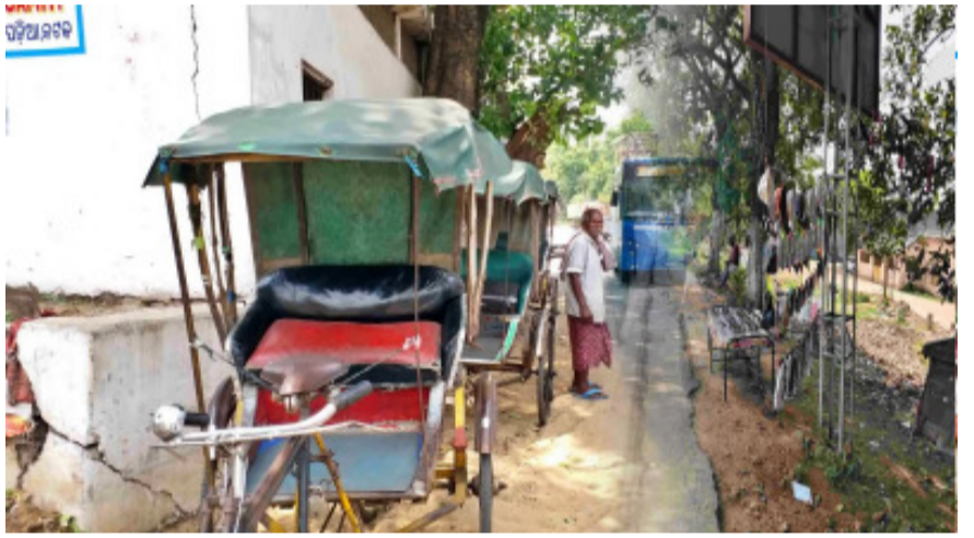
ବସଷ୍ଟାଣ୍ଡରେ ବସରୁ ଓହ୍ଲାଇ ରିକ୍ୱାରେ ଯାଇଥାନ୍ତି ସେମାନେ ବି ଆଉ ଆସୁ ନାହାନ୍ତି । ଗରମ ପାଇଁ ଆଉ କେହି ରିକ୍ୱାରେ ଯାଇ ନାହାନ୍ତି ।

କଟକ: ଗରୁନି ରିକ୍ୱା, ରାସ୍ତା କଡ଼ ବୋକାଳ ଗୁଡ଼ିକରେ ମାଛିଟିଏ ମଧ୍ୟ ଉତ୍ତୁନାହାନ୍ତି... ଯେଉଁ ଦହିବରା ବୋକାଳରେ ଭିଡ଼ ଦେଖିବାକୁ ମିଳୁଥିଲା ସେତିକାଁ କାଁଲୋକ ଆସୁଛନ୍ତି ।