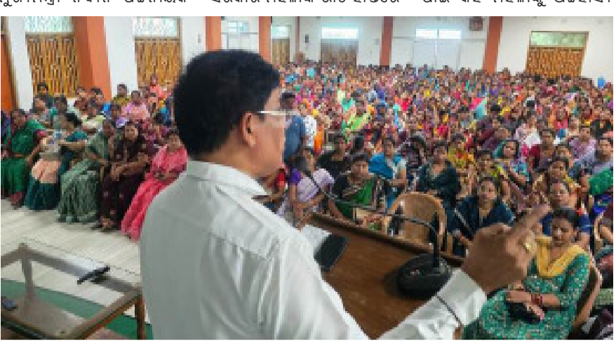
ମହିଳାଙ୍କୁ ବିଶ୍ୱରେ ପରିଚିତ କରାଉଥିଲେ । ତବଲ ଇଞ୍ଜିନ

ନୟାଗଡ଼, ୨୫/୫ (ଆନିସ) : ନୟାଗଡ଼ ବିଜେଡି କାର୍ଯ୍ୟାଳୟରେ ମହିଳା ଅଧିକାର ଅଭିଯାନ କାର୍ଯ୍ୟକ୍ରମ ଅନୁଷ୍ଠିତ ହୋଇଯାଇଛି ।