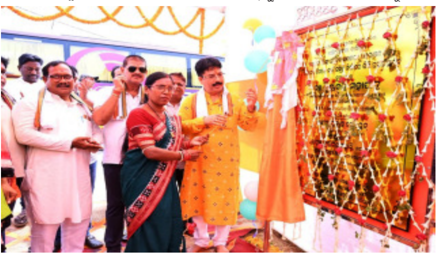
ଶିଳାନ୍ୟାସ କରାଯାଇଥିବାବେଳେ ଉତ୍ତରୀ ବନ୍ଧ ସମ୍ପର୍କ ଅଞ୍ଚଳ, ଦୁର୍ଗା ସମ୍ପର୍କ ଅଞ୍ଚଳରେ ସହରାଞ୍ଚଳ କଳା ସମସ୍ୟାର ସ୍ଥାୟୀ ସମାଧାନ କରାଯାଇଥିଲା ।

ବାରପଦା, ୨୫୫୫ (ଆନିସ): ରାଜ୍ୟ ସରକାରଙ୍କ ସହରାଞ୍ଚଳ ଭିତ୍ତିଭୂମି ବିକାଶ ଏବଂ ଜନସାଧାରଣଙ୍କୁ ଉନ୍ନତ ନାଗରିକ ସୁବିଧା ଯୋଗାଇଦେବା ଲକ୍ଷ୍ୟରେ ବାରପଦା ପୌରାଞ୍ଚଳରେ ୨୫ କୋଟି ଟଙ୍କାରୁ ଉର୍ଦ୍ଧ୍ୱ ମୂଲ୍ୟର ବିଭିନ୍ନ ଉନ୍ନୟନମୂଳକ ପ୍ରକଳ୍ପର ଶିଳାନ୍ୟାସ କରାଯାଇଛି ।