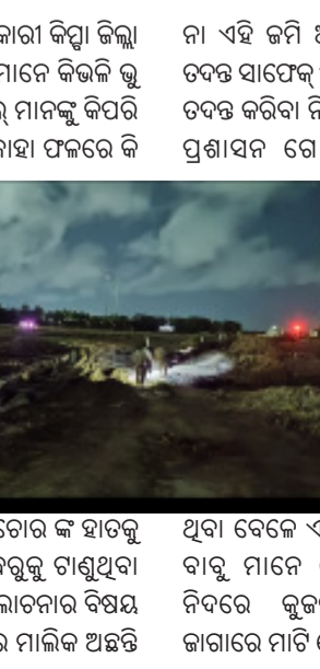
ଚାଷୀ ନିଜର ଚାଷ ଜମିକୁ ଚୋର କି ହାତକୁ ଟେକିଦେଇ ଭବିଷ୍ୟତ ଅନ୍ଧାରକୁ ଟାଣୁଥିବା ବୁଦ୍ଧିଜୀବି ମହାଲରେ ଆଲୋଚନାର ବିଷୟ ପାଲଟିଛି ପ୍ରକୃତରେ ଜମିର ମାଲିକ ଅଛନ୍ତି

କିମ୍ବା କୁଜଙ୍ଗ ପୋଲିସ ଅଧିକାରୀ କିମ୍ବା ଜିଲ୍ଲା ପ୍ରଶାସନର କମି ମାଲିକ ମାନେ କିଭଳି କୁ ସମ୍ପତ୍ତି ଲୁଣ୍ଠନ କାରୀ ଦଳାଳ ମାନଙ୍କୁ କିପରି ନିଜ ଜମିକୁ ନଷ୍ଟ କରୁଛନ୍ତି ତାହା ଫଳରେ କି